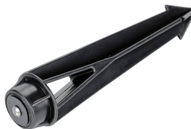
Рисунок 2. Основание для установки в грунт (арт. 024888).