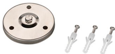
Рисунок 1. Основание для установки на поверхность (арт. 024890).